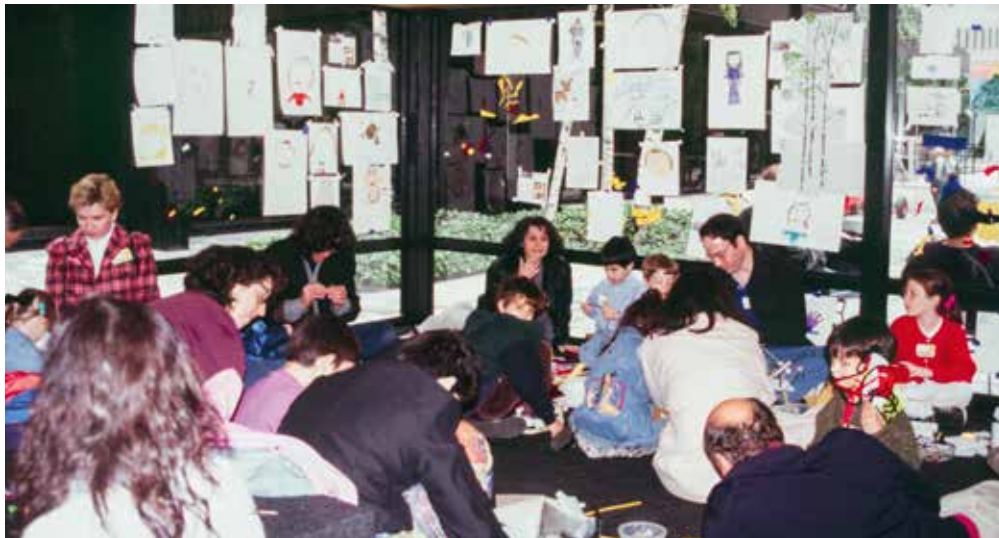
untitled 1997 (playtime) , 1997, veduta dell'installazione, "Projects 58: Rirkrit Tiravanija", The Museum of Modern Art, Abby Aldrich Rockefeller Sculpture Garden, New York, 1997

serva: «Il motivo è che i bambini “distruggono” le cose, ma lo fanno a modo loro, dal momento che vedono tutto in maniera diversa. Hanno un senso del valore particolare, anzi talvolta non lo hanno affatto. Trovo interessante che ci siano persone che, in modo spontaneo e istintivo, cambiano uno spazio perché lo vedono in modo diverso da quello che è».