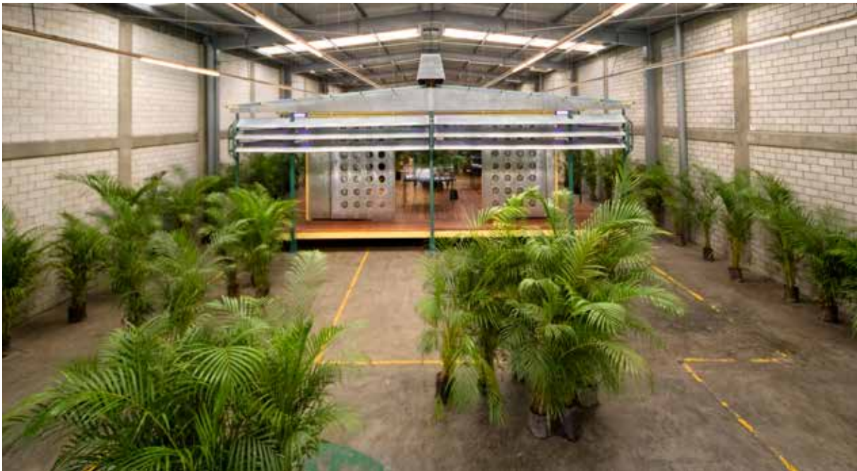
untitled 2006-08 (palm pavilion), 2006-08, veduta dell'installazione, kurimanzutto, Città del Messico, 2008

In untitled 2006 (tropical house) Tiravanija reinterpreta in versione più compatta l'unità abitativa progettata da Prouvé, installando al suo interno un bagno alla turca dotato di richieste di visto Schengen come carta igienica. L'intervento introduce una riflessione sui confini, sulla mobilità e sull'eredità amministrativa del colonialismo.