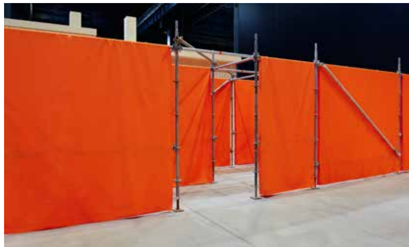
Particolare del labirinto nella mostra “The House That Jack Built”, Pirelli HangarBicocca, Milano, 2026.

Il percorso espositivo si sviluppa come una sequenza cinematografica: una successione di scenari da attraversare, esplorare e abitare nei quali i visitatori possono avere occasioni di incontro legate a esperienze di svago, riposo, cura, convivialità e partecipazione. Il titolo della mostra, “The House That Jack Built” (La casa che Jack ha costruito), richiama una filastrocca inglese del XVIII secolo, la cui struttura cumulativa che aggiunge passaggi e azioni a catena accompagna progressivamente la definizione del soggetto: una casa che prende forma elemento dopo elemento, fino a configurarsi come una costruzione complessa e potenzialmente instabile. All'ingresso, l'installazione untitled 2026 (demo station no. 9) (2026) richiama nella sua struttura la piattaforma teatrale Raumbühne , creata nel 1924 dall'architetto austriaco Friedrich Kiesler, ed è concepita come uno spazio per l'attivazione di azioni. Proseguendo si incontra un “labirinto” realizzato in tessuto arancione – colore ricorrente nell'opera di Tiravanija e riferimento agli abiti tradizionali dei monaci buddhisti – che al suo interno ospita altre opere, generando un percorso immersivo in cui lo spazio e il tempo sembrano dilatarsi. Alla fine del labirinto, prima dell'entrata del Cubo, il visitatore arriva a una soglia ispirata a un elemento circolare del Memoriale Brion (1970-1978) dell'architetto veneziano Carlo Scarpa, che conduce all'ultima opera in mostra.