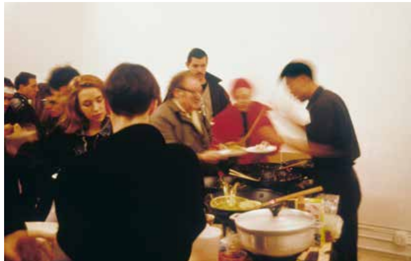
untitled 1990 (pad thai) , 1990, durante l'apertura della mostra, Paula Allen Gallery, New York, 1990

A partire da queste riflessioni l'artista realizza untitled 1987 (text in red and black) (1987), in cui scrive una frase sul muro dello spazio espositivo dell'università attraverso la quale mette in scena, in modo diretto e provocatorio, una richiesta di restituzione: «Chiediamo che ci vengano restituiti i manufatti della nostra cultura conservati al museo dell'Art Institute of Chicago. Altrimenti lo faremo saltare in aria». Negli anni successivi questa riflessione si traduce in una produzione artistica che mette in discussione le convenzioni museali, dall'allestimento alle modalità attraverso cui le istituzioni organizzano e trasmettono la conoscenza. L'intento non è più soltanto quello di denunciare i meccanismi di attribuzione di valore, ma di riportare gli oggetti nella loro dimensione d'uso e di relazione originaria. Un