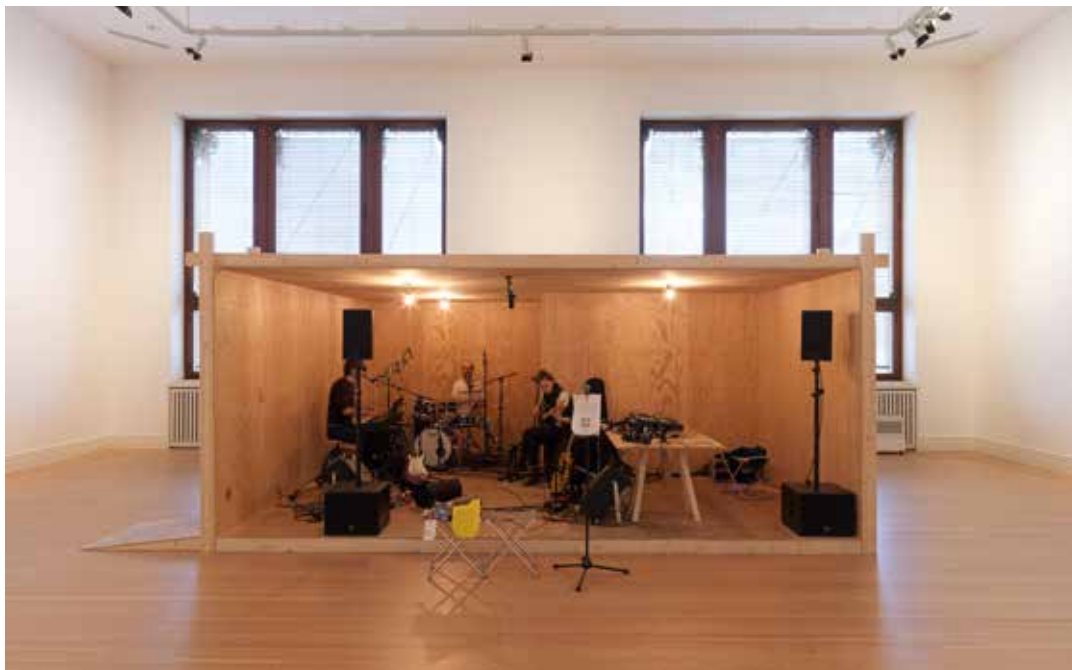
untitled 1996 (rehearsal studio no. 6, open version), 1996, veduta dell'installazione, "Rirkrit Tiravanija: DAS GLÜCK IST NICHT IMMER LUSTIG", Gropius Bau, Berlino, 2024