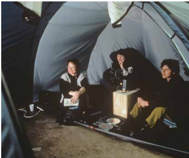
untitled 1997 (cinéma de ville, berlin-bangkok), 1997, veduta dell'installazione, Akademie der Künste, Biennale di Berlino, 1998

so riprese in Super 8 di edifici, strade e persone, con attenzione ai dettagli della vita quotidiana. untitled 1998 (cinéma de ville) presenta invece immagini di skateboarder fotografati nel 1998 a Parigi sull'ampio piazzale tra il Musée d'Art Moderne de la Ville de Paris e il Palais de Tokyo, mettendo in luce uno spazio urbano vissuto come centro di attività sociali e ludiche.