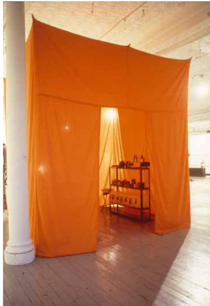
untitled 1992 (cure) , 1992, veduta dell'installazione, "Fever", Exit Art, New York, 1992

In untitled 1997 (cinéma de ville, berlin-bangkok) , due film proiettati in due tende mostrano Berlino e Bangkok a metà degli anni novanta, documentando il rapido mutamento delle città attraverso