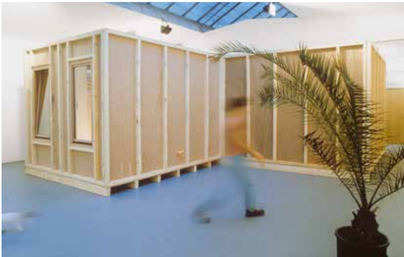
untitled 1996 (tomorrow is another day) , 1996, veduta dell'installazione, Kölnischer Kunstverein, Colonia, 1996

una nuova prospettiva che l'artista rende manifesta come dichiarazione d'intenti introducendo la dicitura "a lot of people" (molte persone) nell'elenco dei materiali riportato in alcune delle didascalie delle sue opere.