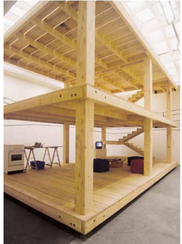
untitled 1998 (dom-ino) , 1998, veduta dell'installazione, "Dom-Ino", Galerie Chantal Crousel, Parigi, 1998

Prova i giochi da tavolo e il biliardino.