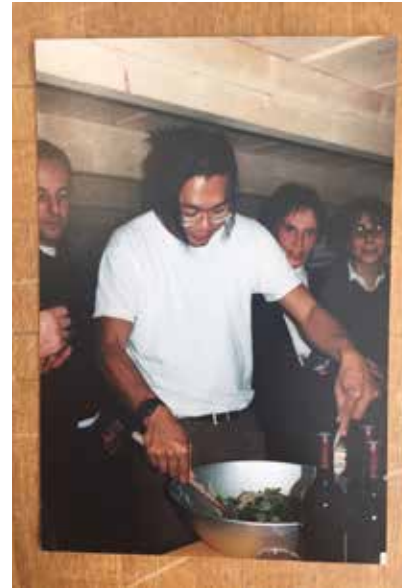
Rirkrit Tiravanija durante l'inaugurazione della mostra "Dom-ino", Galerie Chantal Crousel, Parigi, 1998

Publicato in primavera 2026, il catalogo dedicato alla mostra è disponibile presso il Bookshop di Pirelli HangarBicocca e online.