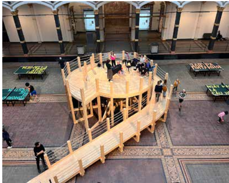
untitled 2024 (demo station no. 8) , 2024, veduta dell'installazione, "Rirkrit Tiravanija: DAS GLÜCK IST NICHT IMMER LUSTIG", Gropius Bau, Berlino, 2024

Strutturata come una casa di un solo piano, l'installazione è concepita come uno spazio dedicato alla fruizione di materiali e alla sosta. Il riferimento è la Kings Road House, progettata nel 1922 dall'architetto austriaco Rudolf Schindler (1887-1953) e situata a West Hollywood, Los Angeles. La casa era pensata come abitazione condivisa tra due famiglie (quella dell'architetto e una coppia di amici) secondo una visione progettuale che metteva in discussione il modello domestico tradizionale. Tiravanija presenta una replica